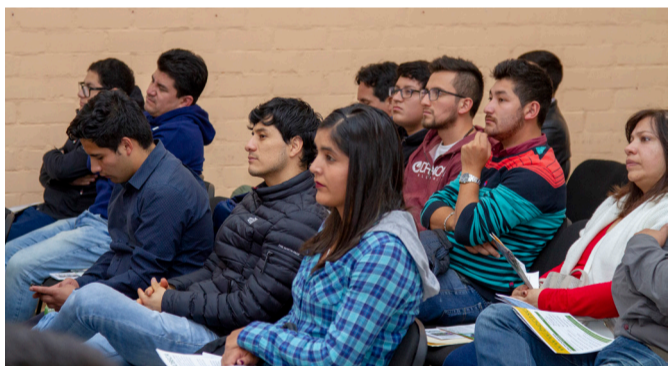
Jóvenes profesionales asisten al inicio de la convocatoria de la Beca Alberto Benavides de la Quintana para conocer los requisitos y así ver la posibilidad de postular.

El Programa de Becas Cajamarca - PROBECA inició en el 2011 con la finalidad de contribuir al desarrollo sostenible e inclusivo de Cajamarca, fortaleciendo el capital humano a través del otorgamiento de becas para especialización a nivel de maestría, estudios de pregrado y cursos cortos de emprendimiento y liderazgo.