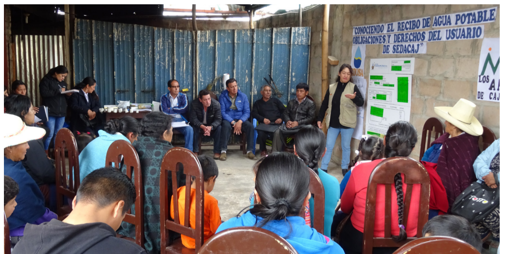
Sesión educativa realizada por el personal técnico del proyecto EDUSA Cuidado del Agua, Municipalidad Provincial de Cajamarca y el personal de la EPS Sedacaj S.A. para lograr el mayor conocimiento del recibo de agua.

El proyecto EDUSA - Cuidado del agua, forma parte del Programa Agua para Cajamarca que ha ejecutado distintos proyectos de infraestructura desde el 2012, logrando incrementar la dotación horaria de agua potable a más de 180 mil cajamarquinos.