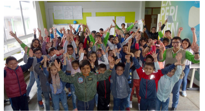
Participantes del curso vacacional desarrollado por el MAT Interactivo en la entrega de reconocimientos y exposición de experimentos.

de Cajamarca quienes estuvieron a cargo del taller y vienen implementando distintas estrategias que promueven la divulgación científica.