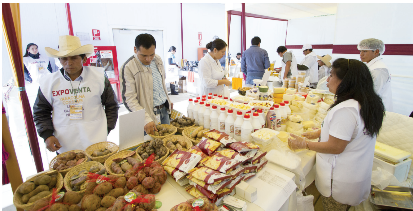
Productores y colaboradores participando de la Expo venta realizada en las oficinas de Yanacochoa.