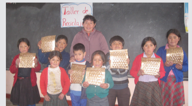
Alumnos de la I.E. de Namococha muestran sus trabajos hechos a base de material reciclable.

El proyecto de Construcción del SAP en Namococha - Componente de Educación Sanitaria, realiza talleres con niños y niñas.