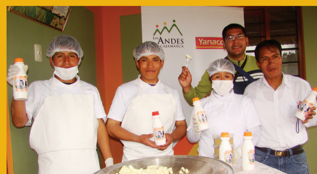
Productores de derivados lácteos de la Asociación “La Shacsha” inician su producción y comercialización de sus productos.

Con el monto obtenido en el concurso los productores han adquirido maquinaria moderna para mejorar su proceso de producción, además han fortalecido capacidades organizacionales y técnicas a través del acompañamiento brindado por FONCREAGRO, aliado estratégico en esta iniciativa productiva.