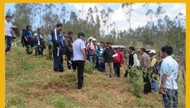
Productores de aguaymanto de San Pablo explicaron las ventajas de su cultivo.

A través de una pasantía a la provincia de San Pablo productores de Celendín reconocieron los beneficios de esta fruta nativa.