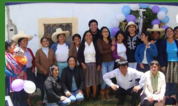
Socias y representantes de ALAC | Yanacocha y Municipalidad Provincial de Cajamarca participaron de la inauguración.

Podrán mejorar su productividad y fortalecer su articulación comercial.