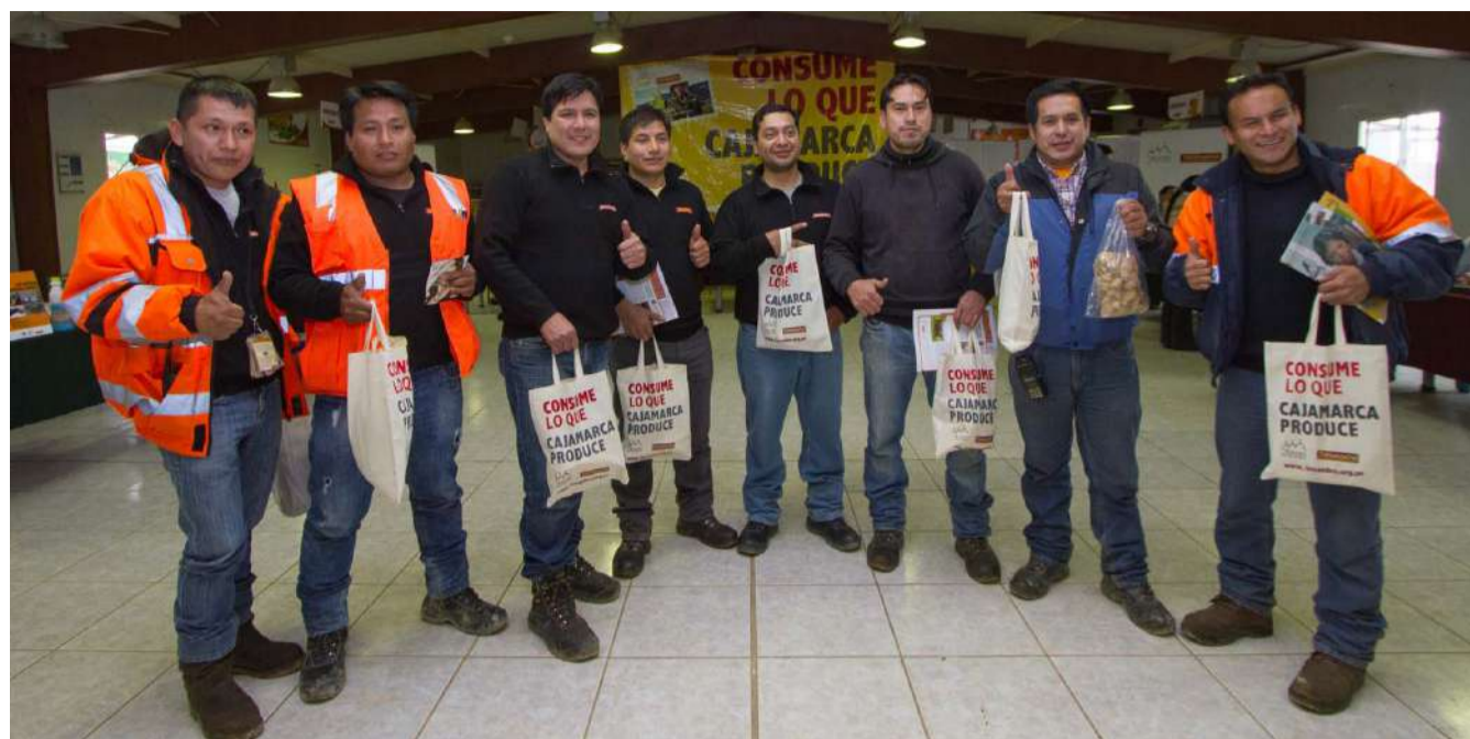
Colaboradores de La Quinoa Complex, conocieron el trabajo de responsabilidad social que realiza ALAC | Yanacocha y adquirieron diversos productos desarrollados en los proyectos productivos.

Productores de los distintos proyectos productivos de ALAC | Yanacocha participaron en la EXPOVENTA "Yanacocha consume lo que Cajamarca produce", esta actividad tuvo el objetivo de difundir las distintas iniciativas productivas que se desarrollan en el ámbito de intervención, así como vender y generar contactos comerciales.